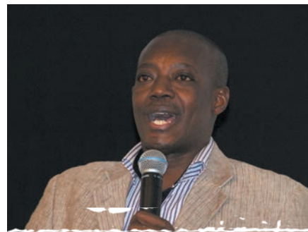
Billeder fra Landskonference 2.

Misforståelser og strid i kirken hjælper os ikke til at udbrede evangeliet. Derfor valgtes der ny ledelse. Vi har besluttet at se bort fra vores forskelle og fokusere på vores kald. Vi vil prøve at forene os, samle vores anstrengelser og se, om vi i de næste