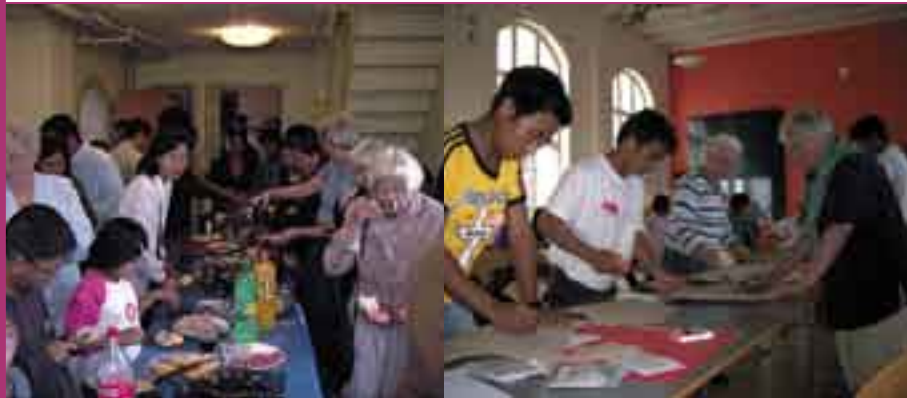
Kirkefrokost efter gudstjeneste.

Den tamilske menighed i Holbæk har sendt stafetten videre til Svendborg Baptistmenighed med spørgsmålet: »I kirken er I både nydanskere og danskere – hvilke udfordringer støder I på, og hvordan klarer I det?« Svendborg Baptistmenighed giver svar på tiltale: