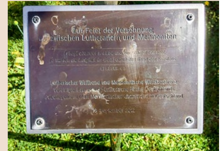
Mindeplade for forsoningen mellem lutheranere og mennonitter

eksemplet viser, hvad det kræver, når majoritet og minoritet skal finde ud af det.