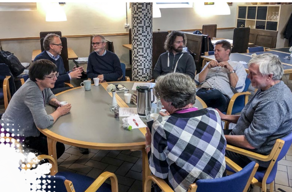
Præsterne i samtale to eller tre sammen.

»» Det er sundt at begynde at dele det svære ved at være en del af fællesskabet. ««