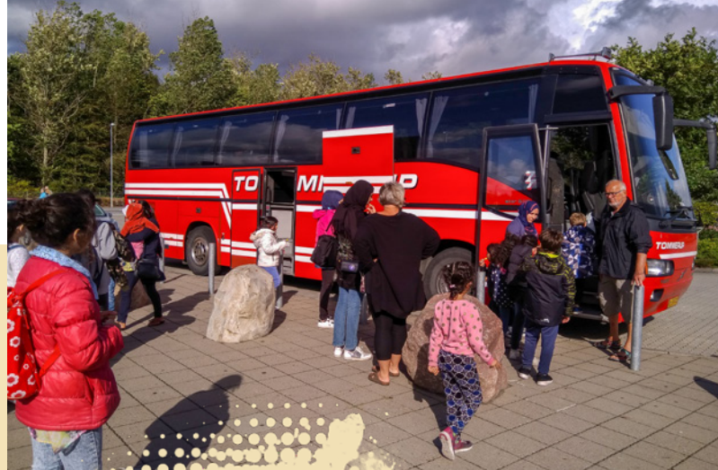
Turen går til Legoland

Den årlige sommerfest er en dag, hvor vi inviterer alle ind i kirken til loppemarked, koncerter, børneaktiviteter, frokost og aftensmad. Dagens overskud – omkring 8.000 kr. – går til det sociale arbejde.