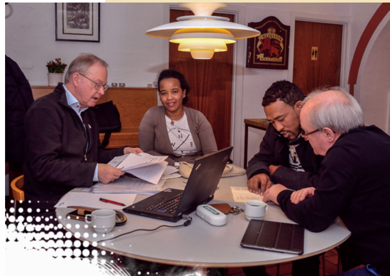
Hjælp med lidt af hvert i TorsdagsCaféen

Sådan blev vi spurgt, da Baptistkirken i Odense i 2016 drøftede en ny vision for menigheden. Vi tror, vi i dag kan svare: »Ja«, for vi har nu mange tilbud til mennesker i Odense. Vi er kendt i byen blandt dem, der har sociale aktiviteter. Foreningen Klosterbakken danner ramme om mange af aktiviteterne.