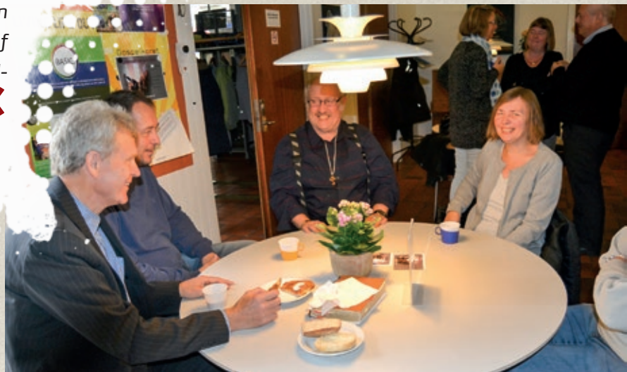
Café Klosterbakken, Odense.