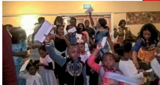
Børnene er ivrige for at aflevere deres kuverter.

ken og betale husleje i den bygning, vi ejer, men ikke kan bruge. Som migrantkirke har vi bestemt medlemmer, som ikke kan få enderne til at nå sammen, eller som er decideret fattige. Som præst leder jeg min kirke til at være omsorgsfuld og gøre, hvad Jesus ville have gjort. Vi beder personerne i menigheden om at hjælpe dem, der har behov for hjælp. – Det er historien om ICBC.