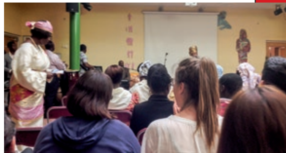
En hvid imellem alle de sorte danskere.