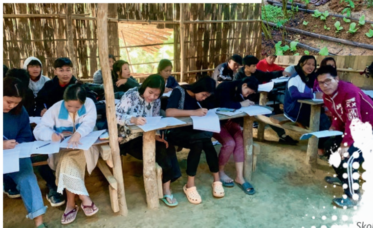
Skole i Sihmui.

Større ting – som fx krigsskader – har de kun ringe mulighed for at behandle. Og den slags forekommer, fordi der er krigshandlinger og militær i områderne. Vi besøgte også et hospital i byen Lawgntlai i Mizoram, der drives af det lokale baptistsamfund. Den aften fik de melding om, at de fire timer senere ville modtage en række krigsskadede patienter fra Chin Staten. Det er en tur på 8-10 timer for de allerede hårdt prøvede patienter.