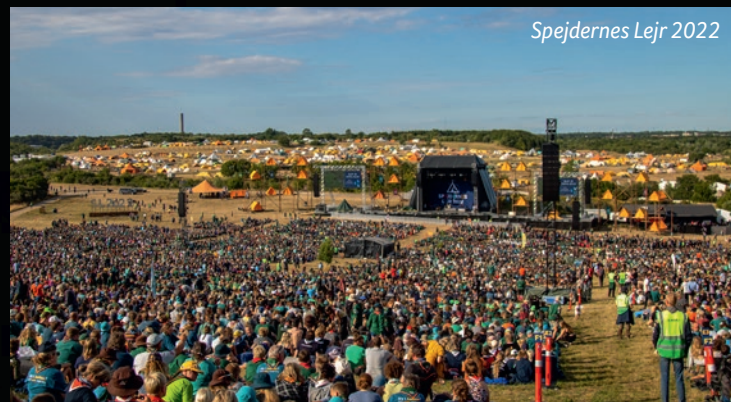
Spejdernes Lejr 2022