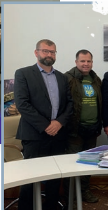
Ødelagte huse i Ukraine, konference for ukrainske baptistpræster i Kyiv samt delegationens møde med en regeringsrepræsentant.