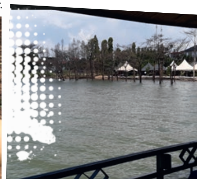
Tanganyika-søen er vokset.