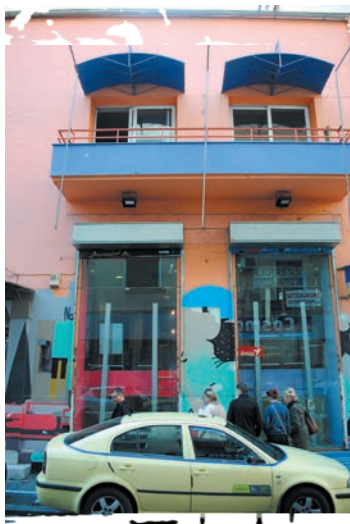
Det kommende Drop-In center i Athen, som snart forventes indviet.