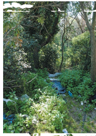
Den primitive overnatning i Alexandra Park i den centrale del af Athen, hvor mange af de uledsagede drenge bor.