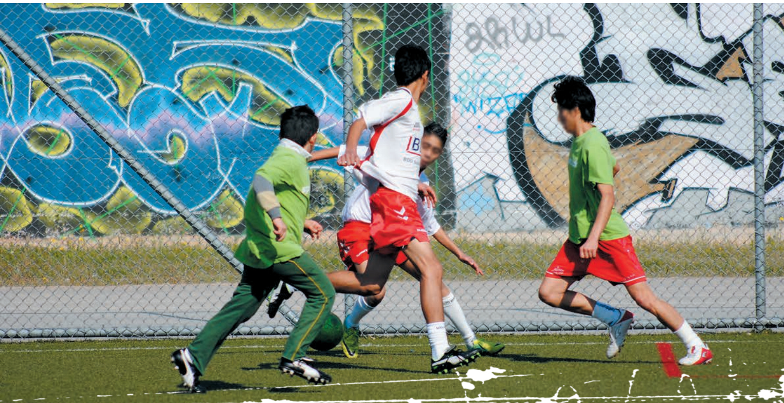
Nogle af drengene på fodboldskolen. Her bl.a. med gamle jyske fodboldtrøjer og lånte støvler.