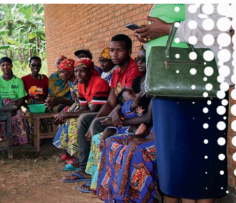
Spare- lånegruppe i projektet.

Sammen med kirkerne i Burundi har vi siden 2013 arbejdet med at ændre sociale normer og opfattelsen af kvinders rolle og værdi i samfundet gennem samtale, træning og opbygning af relationer. Mænd vil gerne noget andet end vold, men de har så at sige ikke andre »værktøjer i værktøjskassen« i konfliktsituationer. Kirken har en unik mulighed for at ændre på dette gennem undervisning og forkyndelse.