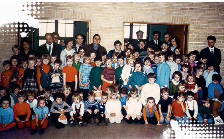
Et glimt fra børnearbejdets storhedstid.

Siden menighedens afsluttende festgudstjeneste i april 2019 har der været afholdt nogle