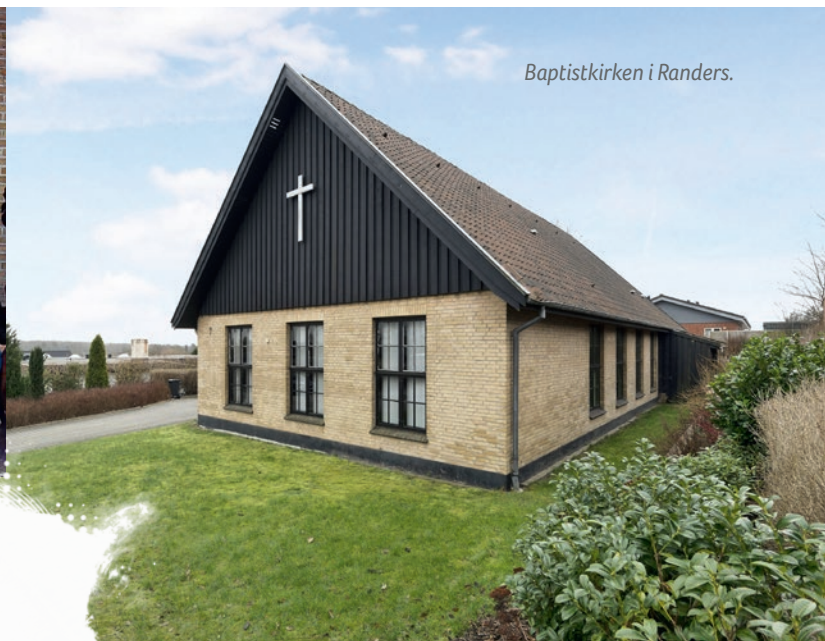
Baptistkirken i Randers.