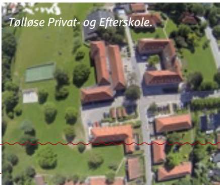
Tølløse Privat- og Efterskole.