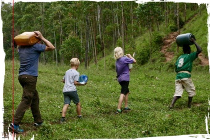
Børnene og Rasmus bærer vand fra dalen i Rubura op til missionærhuset – vi skulle prøve det én gang selv. Det er ca. 100 højdemeter, de tunge dunke skal bæres fra dalen til huset.

Læs om flere af familiens oplevelser i den udvidede artikel på www.baptist.dk .