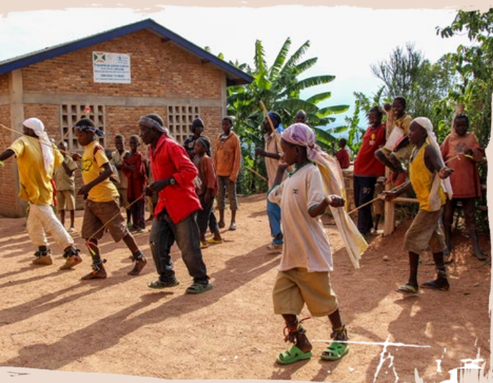
Batwaer danser i Cendajuru.

For mig bekræfter det, hvordan kirken kan transformere livet, og hvor meget vi faktisk kan gøre for at ændre ubalancer i både kirken og det omkringliggende samfund! Arbejdet, vi har fået lov at være en del af, gør en forskel – og der er masser af vindere og stærke kvinder!