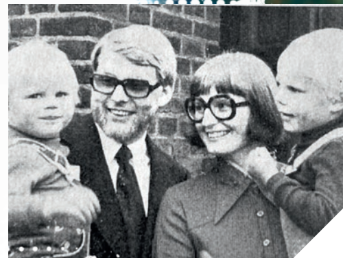
Præstespire i Tølløse 1968 – og præstefamilien på trappen til Immanuelskirken i Aarhus 1975