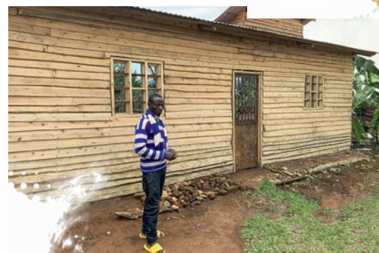
Efter hans hus brændte, har en indbygger fået et nyt hus med hjælp fra kirken, der deltager i projektet.

Menighedsbaseret diakoni er i sidste ende netop det: tro i handling – hjælp til selvhjælp – båret af fællesskab, ansvar og håb.