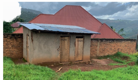
Nye toiletter finansieret af egne midler som en aktivitet i projektet.