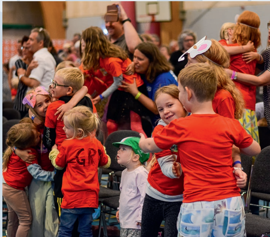
Afslutningsfesten for Kidz blev en fest for alle deltagere.