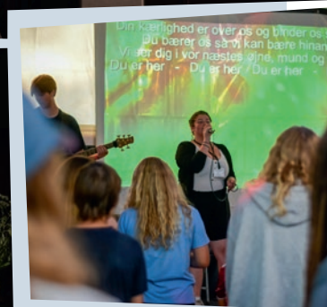
»Guds rige midt imellem jer« dramatiseret af Roskilde Baptistmenighed ved åbningen.